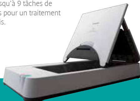
Glace d'exposition A4 Flatbed 101 optionnelle

eCopy PDF Pro Office est une application de bureau puissante et simple qui permet de créer, modifier et convertir des documents PDF plus facilement que jamais.