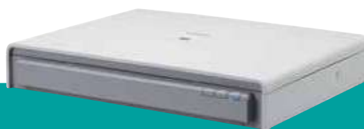
Glace d'exposition A3 Flatbed 201 optionnelle